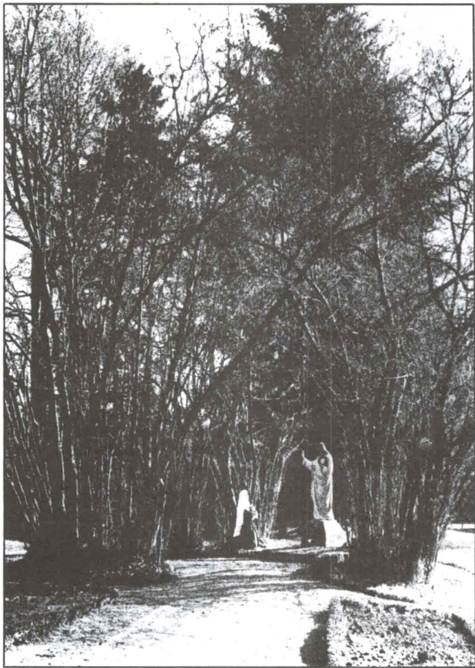
Bosquecillo de los avellanos